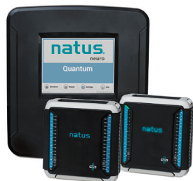
NEU! Natus Quantum