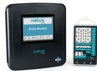
NEU! Natus Brain Monitor