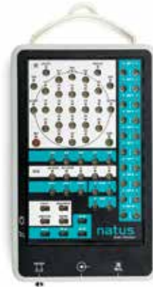
Natus Brain Monitor*

Vielseitiger Verstärker, auf verschiedene Testoptionen erweiterbar