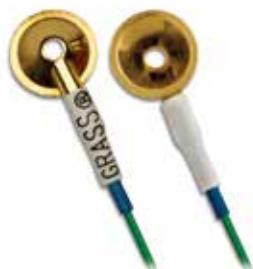
坚固的纯银铸造杯，经抛光处理， 表面光滑