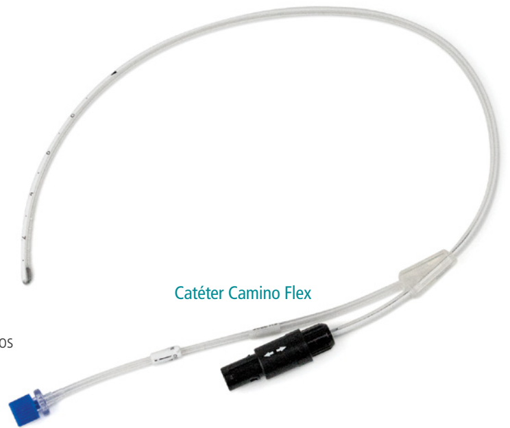
Catéter Camino Flex