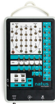
Natus Brain Monitor*

Vielseitiger Verstärker, auf verschiedene Testoptionen erweiterbar