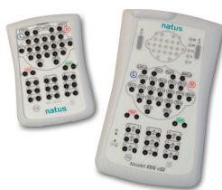
V 32 de Nicolet®