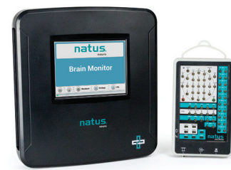
NOUVEAU ! Natus Brain Monitor