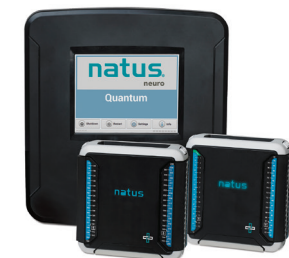
NOUVEAU ! Natus Quantum