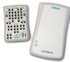
v44 de Nicolet®