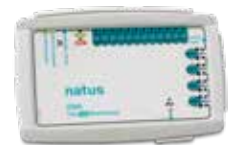
Monitoring Trex HD