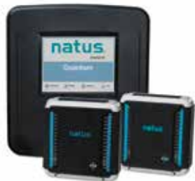
NOUVEAU ! Natus Quantum