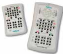
V 32 de Nicolet®