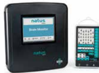
NOUVEAU ! Natus Brain Monitor