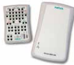
v44 de Nicolet®