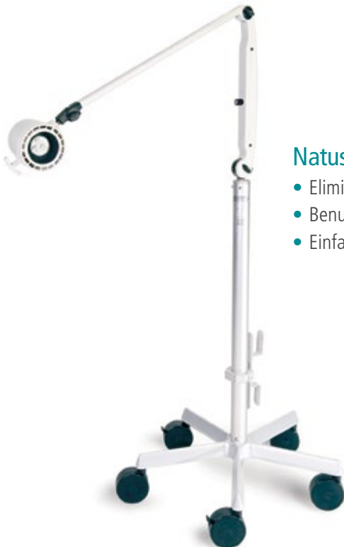
Natus LED Photostimulator