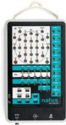
Natus Brain Monitor*

Vielseitiger Verstärker, auf verschiedene Testoptionen erweiterbar