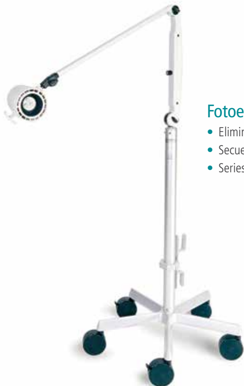
Fotoestimador LED Natus