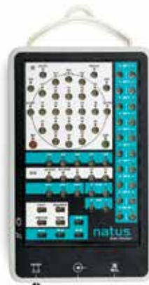
Natus Brain Monitor*

Amplificador versátil ampliable para diferentes opciones de pruebas