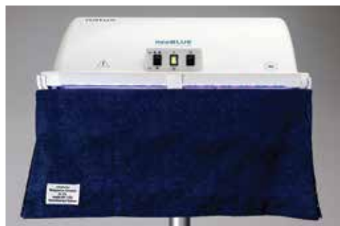
neoBLUE-System mit Vorhang (Zubehör)

neoBLUE-LEDs geben blaues Licht im Spektrum von 450 bis 475 nm ab. Dieser Bereich entspricht der Wellenlänge der maximalen Absorption (458 nm), bei der Bilirubin am wirksamsten abgebaut wird.