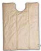
Tamaño 30 72,9 cm de ancho × 90,2 cm de largo (28,7" × 35,5")