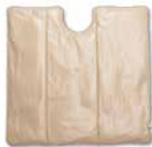
Tamaño 31 98,3 cm de ancho × 90,2 cm de largo (37,8" × 35,5")