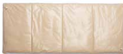
Tamaño 40 76,2 cm de ancho × 193,1 cm de largo (30" × 76")

Distintas fuentes de vacío. Utilice la succión instalada en la pared del quirófano, bombas de aspiración o cualquier otra fuente de vacío que haya cerca.