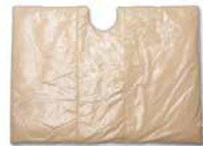
Tamaño 32 118,6 cm de ancho × 90,2 cm de largo (46,7" × 35,5")