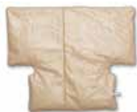
Tamaño 35 87,6 cm de ancho × 71,1 cm de largo (34,5" × 28")