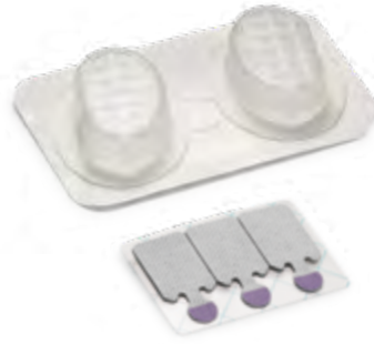
Flexicoupler® und JellyTab®