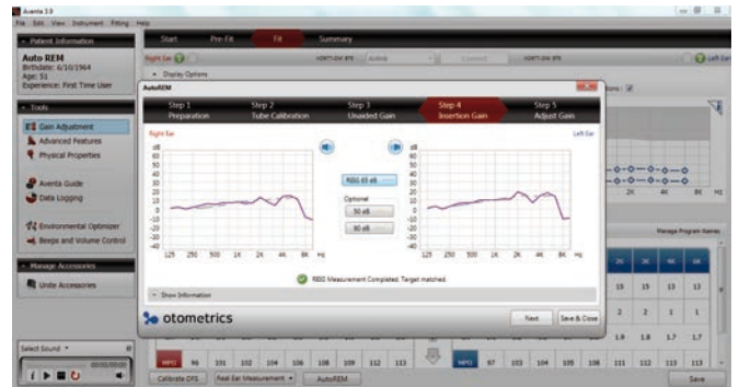
Aurical vereinfacht die Anpassung an ein vorgegebenes Ziel innerhalb der IMC2-fähigen Herstellersoftware AutoRem von Resound Aventa® oder TargetMatch von Phonak Target™

Jetzt können Sie auch die Subjektive Anpassung als festen Bestandteil Ihres Workflows einbinden. Anstatt das Arbeiten mit zwei Systemen zu erlernen, benötigen Sie nun nur noch ein System und können sich voll und ganz auf die Anpassung innerhalb der Software des Hörgeräteherstellers konzentrieren.