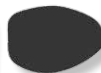
Cobertura Olho Esquerdo