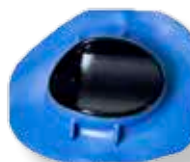
Concha Olho Direito