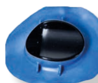
Copo do olho direito