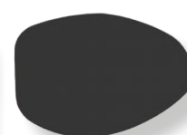
Proteção do olho esquerdo