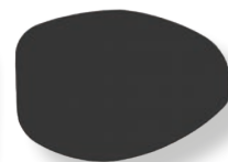
Parche del ojo izquierdo