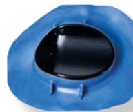
Copa para el ojo derecho