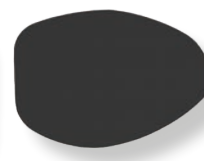
Patch oeil gauche